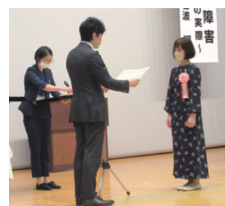
永年勤続功勞表彰