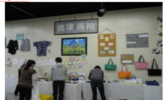
昨年度のアート展

バザー・うまいもん市 作業所などで作られている「うまいもん」と、授産製品の販売、ご賞味あれ!! 11月16日(金) 10時~15時 会場：6階小ホール入り口