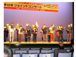
昨年度のコンサート

♪ジョイントコンサート♪♪♪ 精神に障害のある方たちや特別ゲスト「オレンチェ」による合唱やバンド演奏!! 11月16日(金) 11時~14時45分 会場：6階大ホール