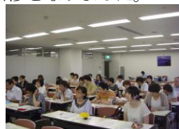
真剣に聴く受講者